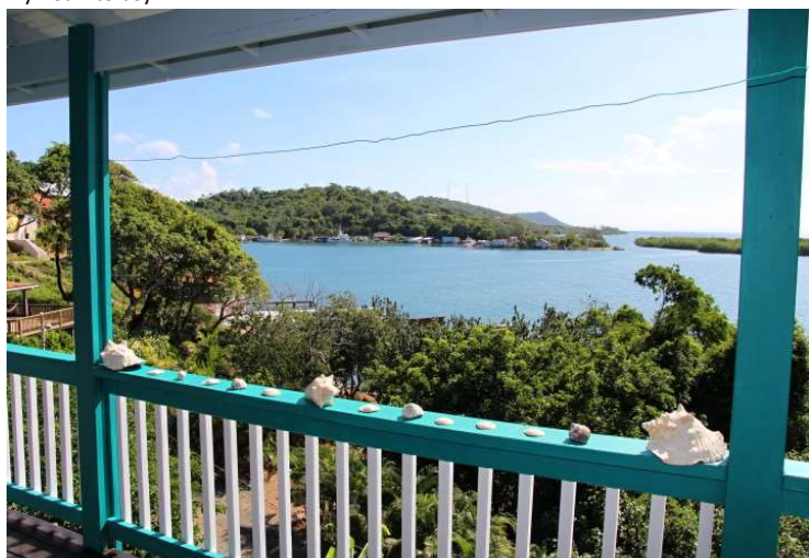
pohled na zátoku