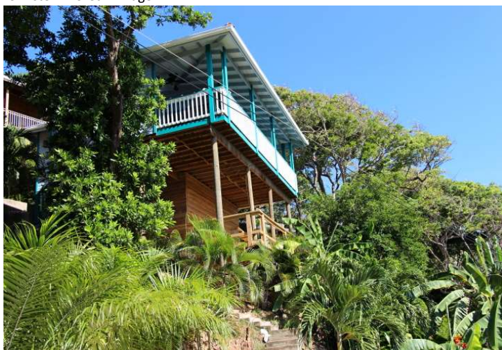
pohled z cesty